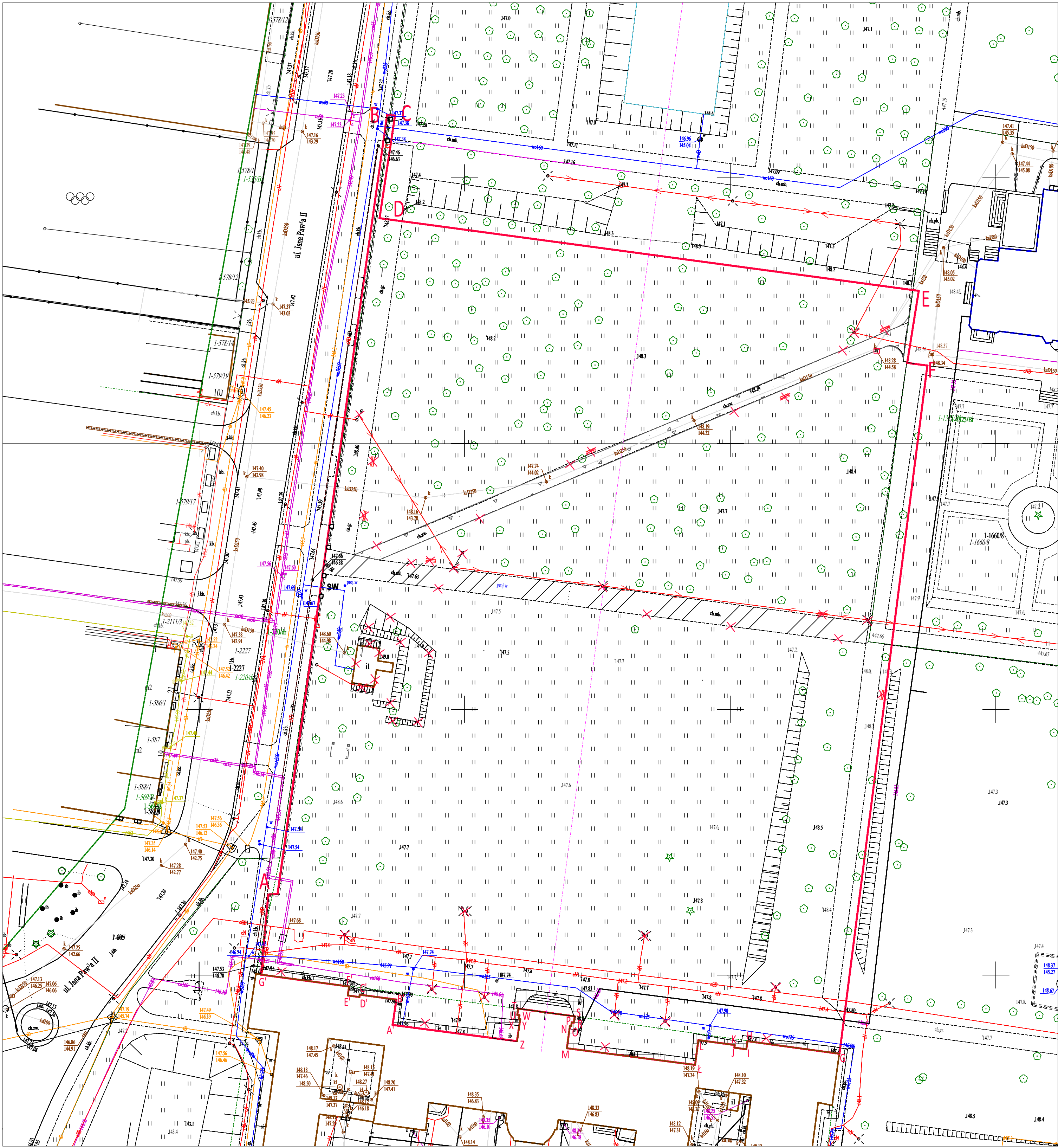
ELEMENTY DO USUNIĘCIA